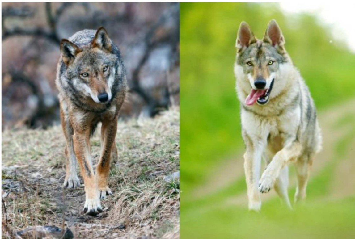
Lupo (sinistra) e cane lupo cecoslovacco (destra). La forma delle orecchie, della coda e la presenza della tipica linea nera lungo le zampe anteriori permettono di riconoscere le due specie.

Il lupo ( Canis lupus ) è un canide di medie dimensioni. Nonostante in Nord America i lupi possano arrivare a pesare fino a 60 kg, il “lupo italiano” ( Canis lupus italicus ), al quale la popolazione svizzera appartiene, è di dimensioni molto più modeste tra i 25-35/40 kg per individui adulti. Le femmine sono in principio più piccole dei maschi. Il mantello ha una colorazione che può variare dal grigio al beige, con una banda grigia scura lungo il dorso. Il lupo è caratterizzato da zampe particolarmente larghe in proporzione al peso corporeo ciò che lo aiuta a sprofondare meno nella neve. Le orecchie sono piccole e arrotondate; la coda, corta e dritta (anche quando abbassata) è caratterizzata dalla punta nera. Le zampe anteriori sono caratterizzate da una linea verticale scura. Il cane lupo cecoslovacco, che spesso viene confuso col lupo, è più grosso (arrivando a pesare più di 40kg), ha orecchie molto più larghe e appuntite, ha una coda più lunga a forma di mezza luna e non ha le linee verticali nere sulle zampe anteriori.