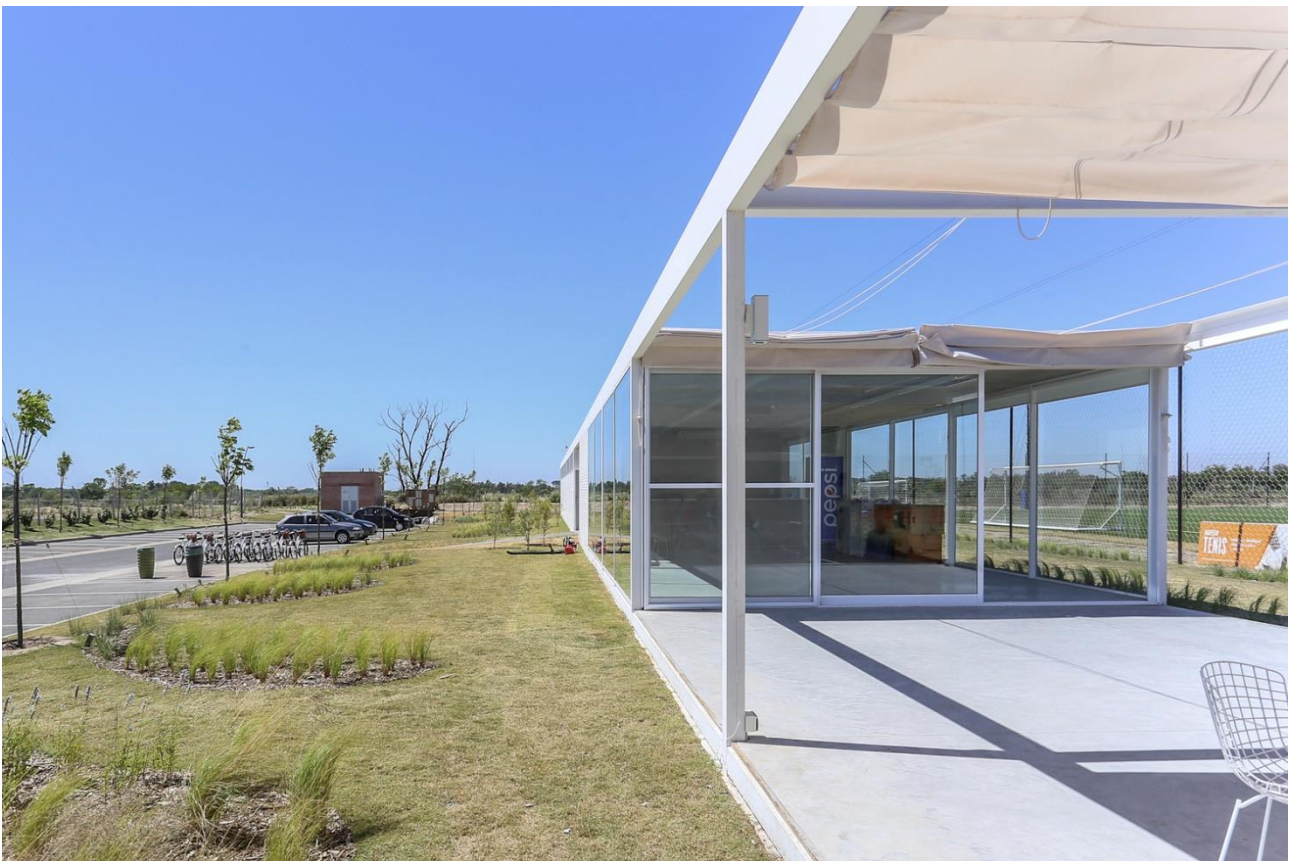
Club Fútbol- Puertos Escobar, Torrado Arquitectos, Puerto Madero (Argentina)

Il progetto rappresenta un ulteriore tassello per il nostro centro sportivo, la cui qualità attuale è frutto anche del contributo dei progettisti che vi hanno finora lavorato. Considerando che questo edificio, una volta realizzato, resterà in loco per diversi anni definendo una parte della vita sociale del paese, si ritiene opportuno prendere il tempo necessario per dedicare una maggiore attenzione alla sua progettazione.