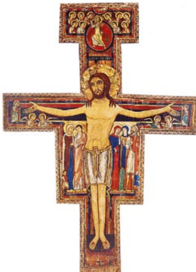
Crocifisso di S. Damiano (Assisi) .....