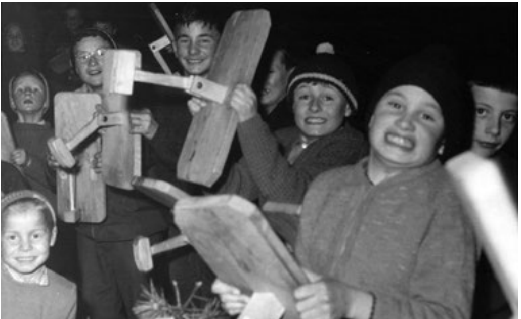
Anni 60

Per il gruppo Tableck: Andrea Pedrini, marzo 2021