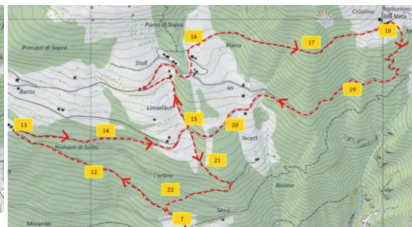
Anello 2. Osco-Predelp-Osco (lungo)